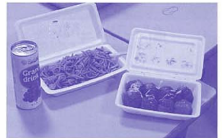
出店に出される予定だった品々

また、フラフープを使った楽しいゲームや、恒例の打ち上げ花火を企画していましたが、見る事が出来ませんでした。