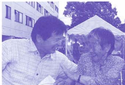
院長賞「ばあちゃんと息子」

こちらの作品は後で、作者に聞いたところ去年の当院夏祭りに撮影された写真の一枚だそうです。最高の笑顔