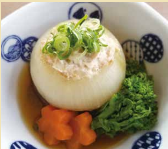
エネルギー 約154kcal(1人分)、調理時間 約90分

玉ねぎの効果…たまねぎには、血液をサラサラにする効果が期待できる硫化アリル、抗酸化作用を持つケルセチン、腸内環境を整える働きがあるオリゴ糖、血糖値の急激な上昇を抑えたりコレステロール値を低下させる効果がある食物繊維や、高血圧予防に効果的なカリウムなどが含まれています。