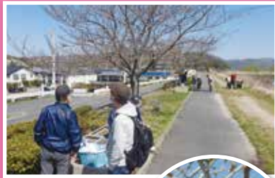
青空の下、 旭川の土手を散歩

3月29日(金)入居者様は、春のドライブに出かけられました。今年は昨年より、桜の開花が遅く、つぼみの状態でしたが、入居者様は久しぶりのドライブを楽しまれました。