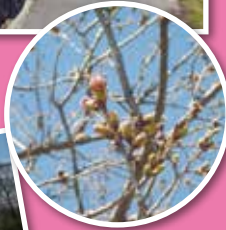
桜のつぼみも まだ固く...