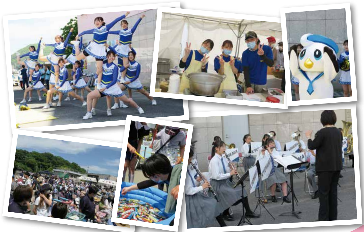
2024 創立70周年記念 万成フェスティバル

教育研修の充実、地域との連携を強化し、 患者さまが安全で安心できる温かい医療サービスを提供します。