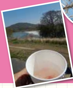
桜茶でのを 潤されました。