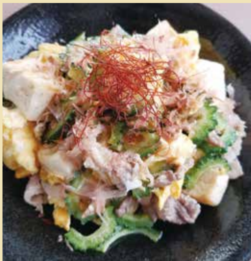
エネルギー 約443kcal(1人分)、調理時間 30分

ゴーヤの効果 …ゴーヤに含まれるモルルデシンには、胃液分泌促進、胃腸を刺激して食欲を促す作用や肝機能をも高める効果、血糖値を下げる効果が期待できると言われています。また、高血圧予防に効果的なカリウム、細胞の成長に必要な葉酸、免疫力を高め美肌効果が期待できるビタミンCなども含まれています。