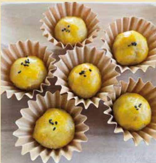
エネルギー 約88kcal(1個分)、調理時間 30分

さつまいもの効果…さつまいもには、食物繊維が豊富に含まれ便秘解消や整腸作用に効果的だと言われています。また、高血圧予防に効果的なカリウムや抗酸化作用があるビタミンE、皮膚や粘膜の健康維持を助けるビタミンB1、美肌に効果的なビタミンCなどビタミンやミネラルが豊富に含まれています。