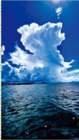
ゲリラ豪雨接近中