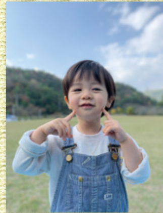
澄んだ秋空の下で