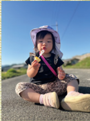
膨らむのは頬ばかり